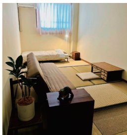
レジデンスルーム 1