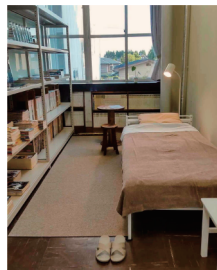
レジデンスルーム 5