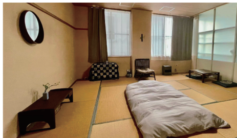
レジデンスルーム 4