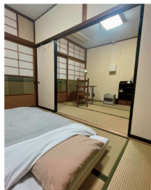
レジデンスルーム 3